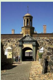
Kasteel de Goede Hoop, Kaapstad