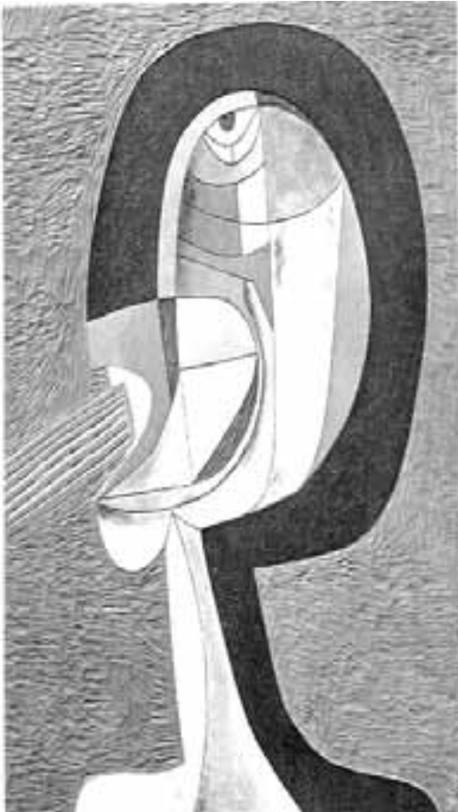
FIGUUR 12: Cecil Skotnes, Gesprek , Houtblokdruk