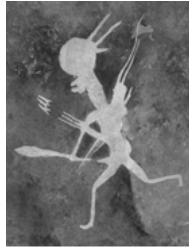
FIGUUR 9: 'n San Rotsskildery

Byna alle vroeë kuns van 'n verskeidenheid kulture is geskep vir rituele of godsdienstige behoeftes en wensvervulling, waarna dikwels verwys word as 'magiese-religieuse' behoeftes.