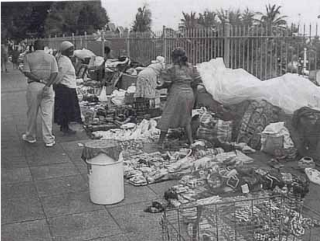
FIGUUR 4: Straatverkopers in Suid-Afrika

Skryf 'n artikel aan jou plaaslike koerant waarin jy sterk kritiek lewer op die munisipaliteit se pogings om die kuns en kunsvlyt wat straatverkopers maak of verkoop, te verwyder uit die dorp, stad of omgewing.