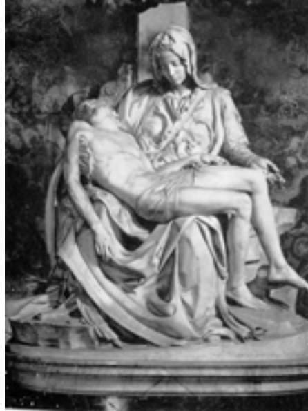
FIGUUR 6: Michelangelo, Pieta , Marmer

4.1 Beeldhouers gebruik 'n visuele en tasbare taal. Hul werk kan geskep word om 'n stelling te maak of iets te sê. Wat, dink jy, 'sê' Michelangelo in hierdie werke? Verwys na VIER van die volgende riglyne in jou bespreking: