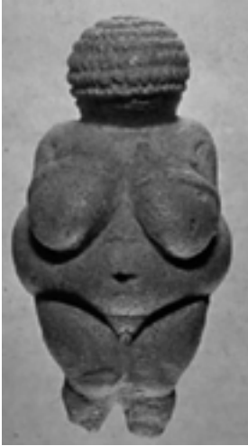
FIGUUR 7: Venus van Willendorf