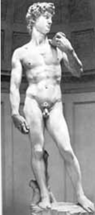
FIGUUR 5: Michelangelo, Dawid , Marmer

Die afbeeldings hieronder stel TWEE van Michaelangelo se kunswerke voor.