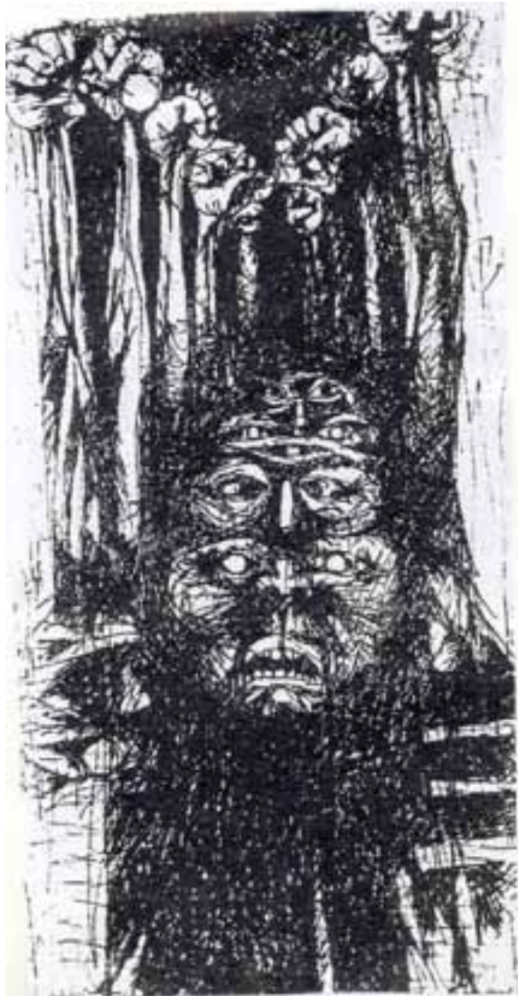
FIGUUR 14: Ongetiteld , Dumile Feni, Tekening.

7.3 Lees die volgende en bestudeer FIGUUR 14: