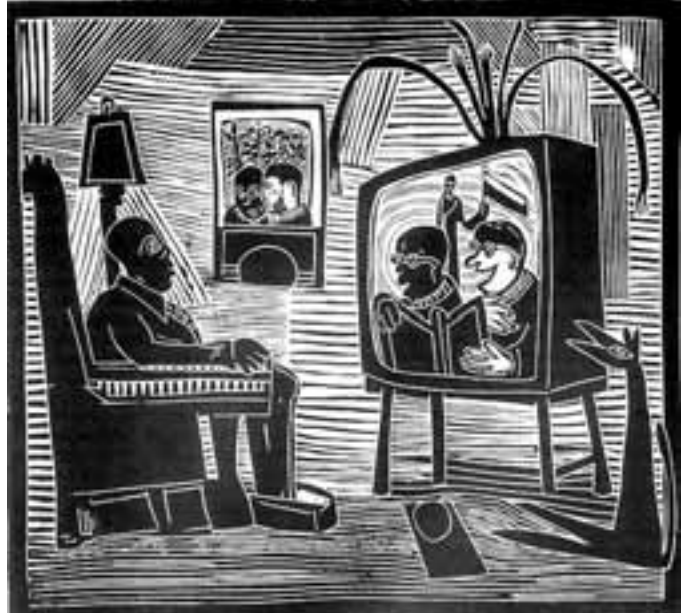
FIGUUR 3: Azaria Mbatha, Die Nuus Linosnee