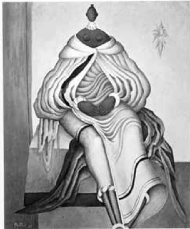
FIGUUR: 13 Alexis Preller, Mapogga vrou , Skildery

Lees die volgende en beantwoord dan die vrae: